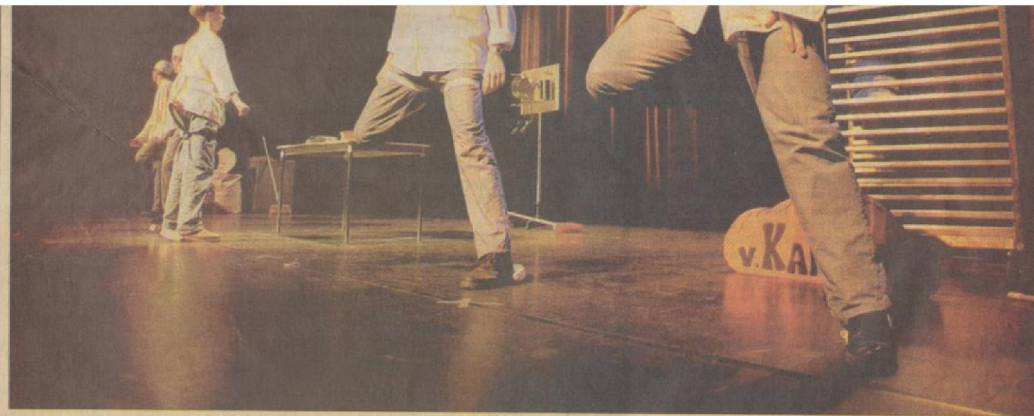
• De flitsende act van bakkerij van Kampen.